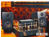
Blue Aura v30 Blackline