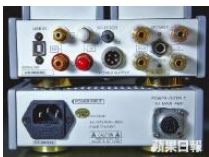
■兩件式設計較v30 Blackline大，設USB及AUX輸入卻沒有headphone頭直接輸入。