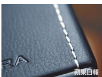
■機身和喇叭都充滿皮革細節位，令觀感更高雅獨特。