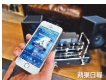
■以headphone頭線直入，手機播歌很簡單。