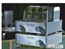
Audio Space Mini-Galaxy1