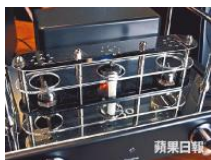
■設三支膽，左右兩支6n1發聲，中間的6e2顯示音量，設計非常美觀，有別於普通膽機。