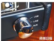
■設USB、Line in、AUX三種簡單輸入，玩法簡單。