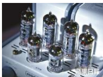
■六膽設計是發揮膽聲的基本。

「雖然Galaxy1都已是十多年前之作，但至今仍相當受歡迎，想買仍要等個多月訂貨。」據他說，要真正發揮膽聲的聲音，六支膽是基本，而細膽與一般膽機的分別其實主要在於輸出功率，大膽應付較大空間，但細膽機亦足夠應付三、四百呎環境，而音色上大細膽其實分別不大，甚至是細膽出來的更多更明顯。雖然Galaxy1與v30 Blackline配合的喇叭不同，比較或會有點不公平，但用上iPhone輸出相同歌曲，感覺Galaxy1明顯較暖厚柔和，聽人聲尤其富感染力，「膽味」濃郁，細節、音場、位置感都出色。